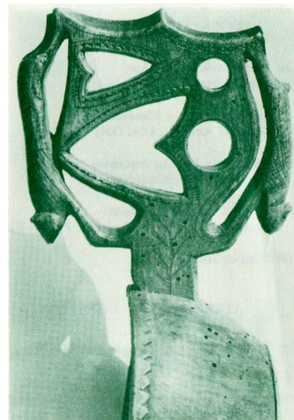
Áttört nyelű csanak, Fülel

1984. augusztus 18-tól augusztus 25-ig Lake Hope State Park, Zaleski, Ohio