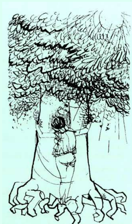
Illusztráció - Nagy László

Idei magyar hetünkön, a múltbeliekhez hasonlóan, formális programunkat — előadások, irodalmi estek — nyaralással, szórakozással kötjük össze.