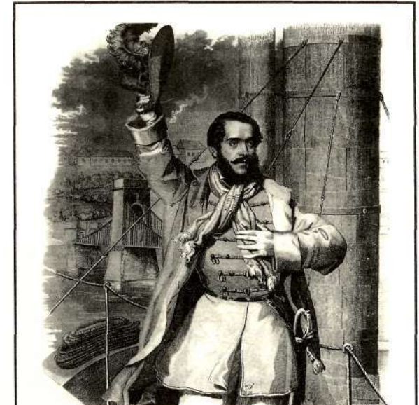
Kossuth visszaérkezése Bécsből 1848. március.

1998. augusztus 15-től 22-ig Lake Hope State Park - Zaleski, Ohio