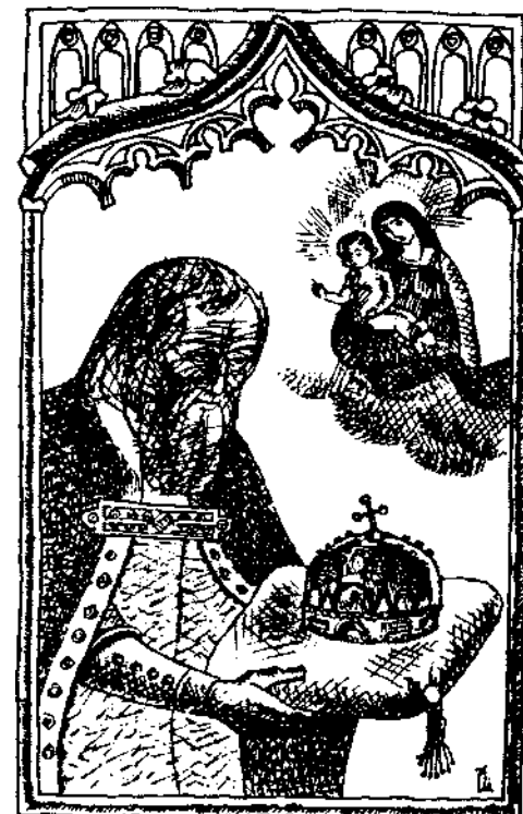
Plugor Sándor grafikája

2000. augusztus 12-től 19-ig Laké Hope State Park - Zaleski, Ohio